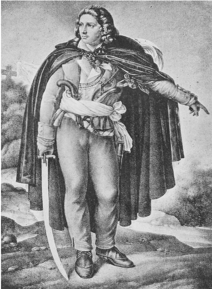
« Jacques Cathelineau »

Ils étaient vingt-sept, n'ayant comme lui qu'un cœur et des bras. Ces vingt-sept volontaires se mettent sous ses ordres. Ils forment le noyau de cette grande armée de laboureurs, que dans trois mois, Jacques Cathelineau , général en chef, conduira sous les murs de Nantes.