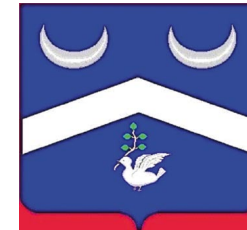
Armoirie des Bouffard de Rouen, France