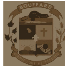
Armoirie des Bouffard Devise: « À bout fort ne fléchis »

Chansons et armoiries (brune) tirées du site du Musée de la Maison Horace Bouffard – Armoiries bleues tirées du site Armorial d'origine de diverses familles québécoises (L'île d'Orléans) et de France.