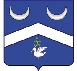
Armoirie des Bouffard du Canada